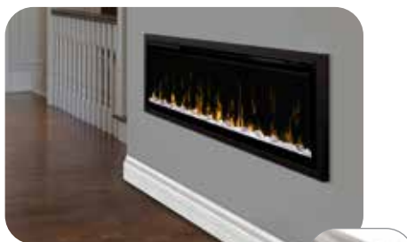
Trousse de garniture IgniteXL – 50 po (XLFTRIM50). Permet l'installation d'IgniteXL dans une construction murale de 2 po x 4 po. 134,0 cm x 46,2 cm x 4,6 cm (52 3/4 po x 18 1/4 po x 1 7/8 po)

120 Volts | 1500 Watts | 5118 BTU 240 Volts | 2500 Watts | 8530 BTU