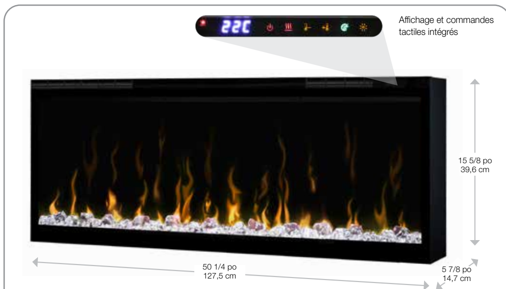
Affichage et commandes tactiles intégrés