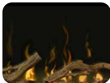
50 po – Ensemble d'accessoires de bois de grève et de pierres de rivière (LF50DWS-KIT)